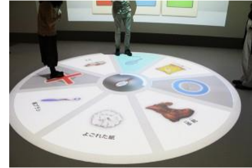
不適ゴミ発見ゲーム

このほかにも各ゾーンに設置したモニタなど、コンピュータグラフィックスや映像等を駆使した設備がある。