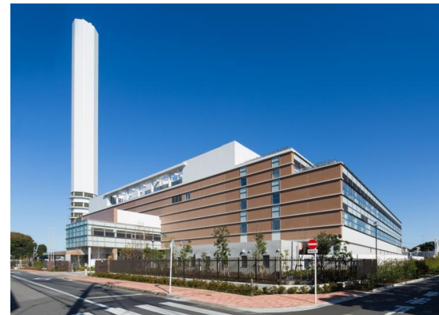
練馬清掃工場外観