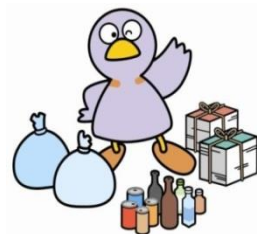
埼玉県マスコット「コパトン」

現在、県内では年間約54万トンの事業系ごみが排出されています。ごみの最終処分場の残余容量がひっ迫している中、ごみの削減は重要な課題です。限りある資源を有効に活用するためにも、以下のチェック項目を参考に、一層のごみ減量・リサイクルに取り組みましょう。